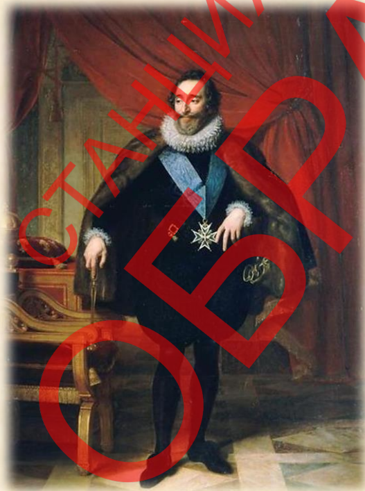
Король Генрих IV

Генрих III (1551-1589) был в молодости избран королём Польши, но сбежал от туда, как только освободился французский престол. Он вернулся в Париж в самый разгар религиозных войн, которые продолжались всё время его нахождения у власти. Генрих III был сторонником католической партии, но по иронии судьбы его убил фанатичный католик, считавший, что король предал дело церкви.