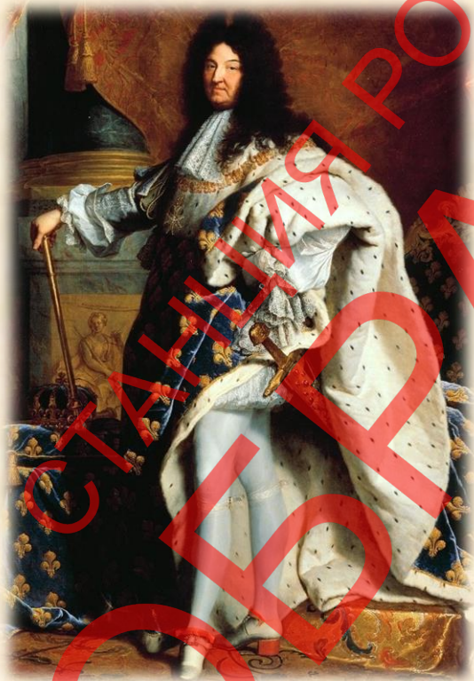
Король Людовик XIV

Но Фронда не прекратилась. Теперь против королевской власти восстали аристократы. Война продолжалась до 1653 года. Во Францию вторглись испанцы, лидер мятежников принц Луи де Конде даже взял Париж. Но после того, как Мазарини завербовал в Германии наёмную армию, военная удача стала клониться на сторону короля. Последние города, поддерживающие фрондёров, пали в 1653 году.