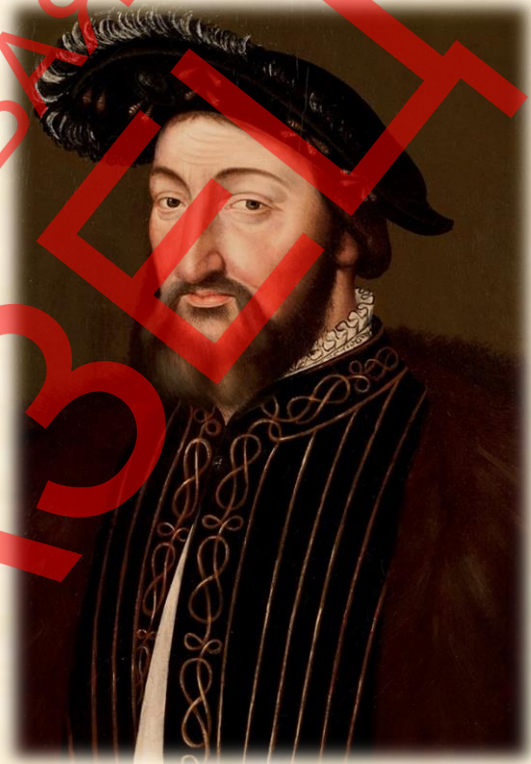
Король Франциск I

Неаполитанское королевство, начав Итальянскую войну (1494—1559). Король Франциск I (1494-1547) на равных соперничал с императором Священной Римской империи и королём Испании Карлом V.