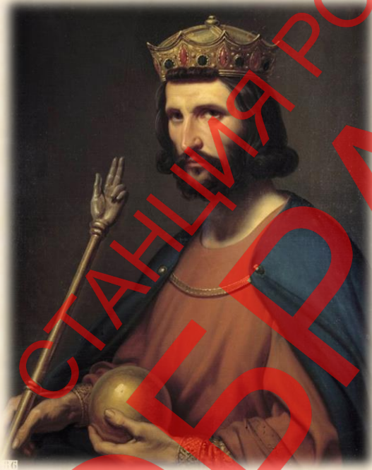
Король Гуго Капет

IX-X века стали эпохой раздробленности Франции. Власть королей слабела, герцоги, графы и бароны все меньше считались с Парижем и вели междоусобные войны. На французском престоле тогда несколько раз оказывались короли из рода графов Парижских. Наконец, когда в 987 году фамилия Каролингов угасла, корону Франции получил граф Гуго Парижский по прозвищу «Капет» (происхождение этого имени неизвестно). Он основал великую династию Капетингов, потомки которой правят Францией вот уже 750 лет.